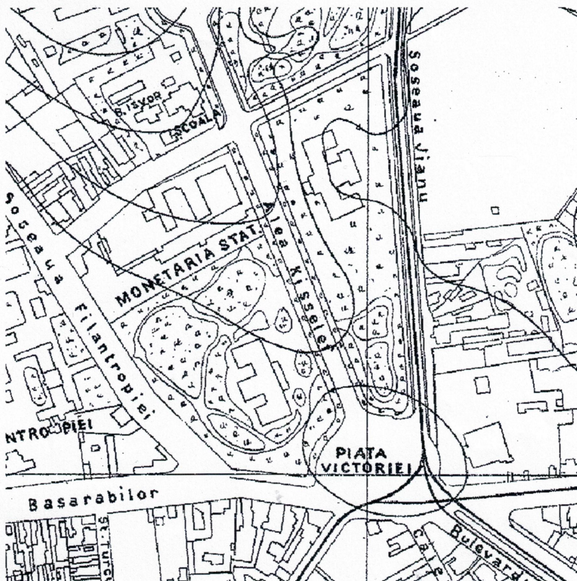
1 – Planul orașului București (Institutul Geografic al Armatei, 1911), detaliu: Aleea Kiseleff, Piața Victoriei și Muzeul de Istorie Naturală.

Restrângând discuția la Muzeul Național de Istorie Naturală "Grigore Antipa", monument istoric de grupa A, spațiul din vecinătatea sa imediată a fost conceput ca o grădină a muzeului, așa cum apare și în planul Bucureștiului din 1911 [1]. Ca martor al viziunii inițiale de amenajare urbanistică și peisagistică a zonei, acest spațiu este parte integrantă a substanței monumentului și a semnificației sale istorico-culturale.